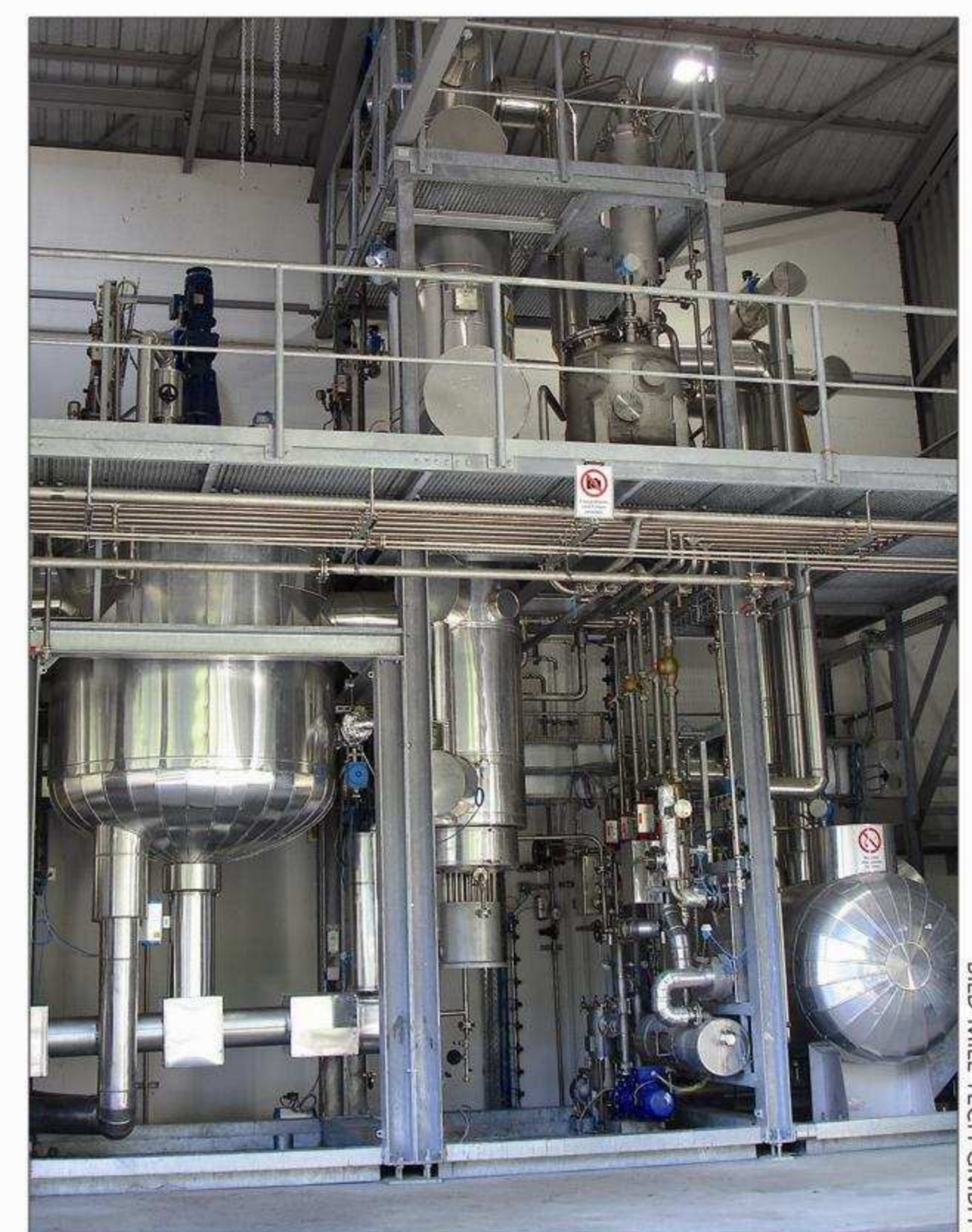
Ausschnitt der Anlage